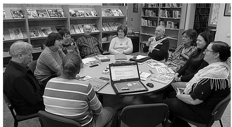
Mulgi keele õpetemine käip kik perimuskultuuri toetuse abige. Pildi pääl om Tõrva murdering.