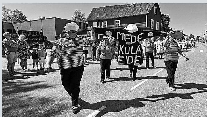
Kärstne naiste pundil om tore nimi ja lustilise tansu.