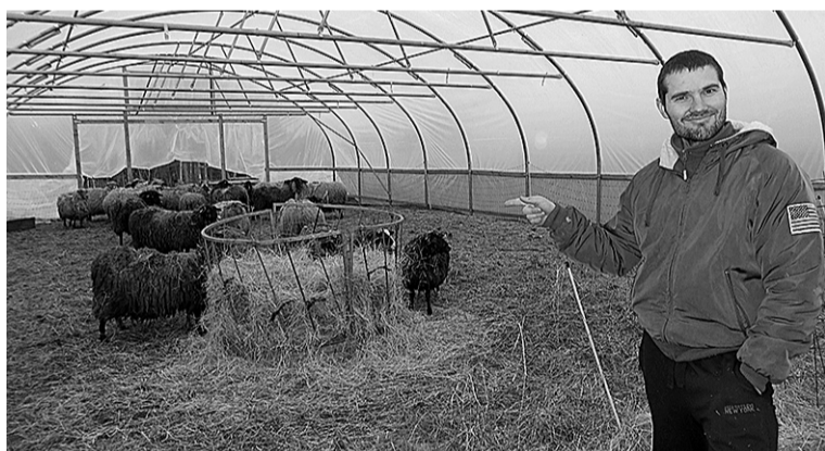
Peremiis kinnitep, et suure kasvuuunen saap nii linde ku luume õlp-saste ületalve pidäde.