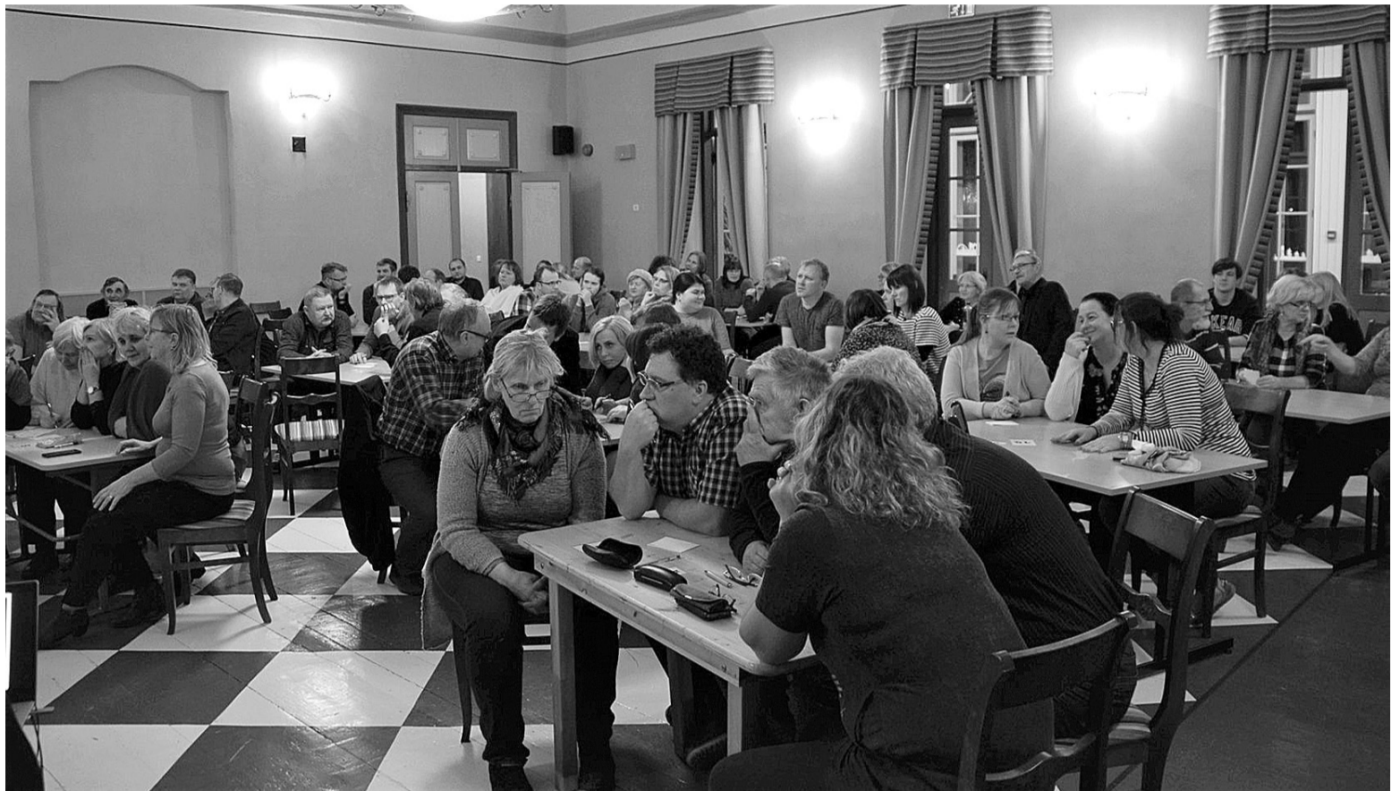
Jaauarikuul olli saalitäis mulke Eimtalii mõisan päid murdman.

Kuna Eestin kuulutedi vällä eriolukord, sis pidime kahjus indajidege tegeme otsusse VII Mulgi mälumäng siikõrd ärä lõpete ja auinna nellä mängujao järgi vällä anda. Arvassime, et ei ole mõistlik perämist jagu ei-tää-kui-kaugele edesi lükäte, leime nellä mängujao punk-