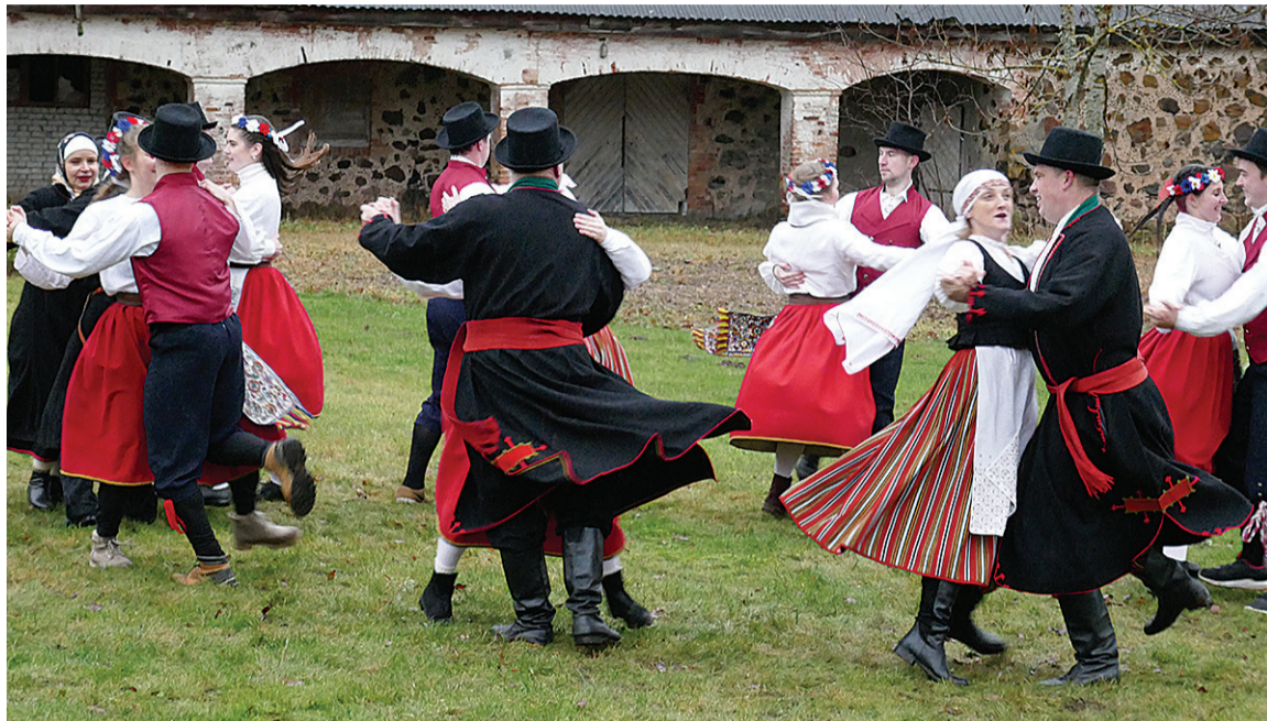
Jaauarikuul tuli ää punt tansjit ja pillimehi Karksi kokku ja alva ilma pääle vaateme tetti edimese tansitiiru ärä. TaaVID Meedia panni sellest kokku tillikse vilmikse, mes om nüid Hooandjan üleven.