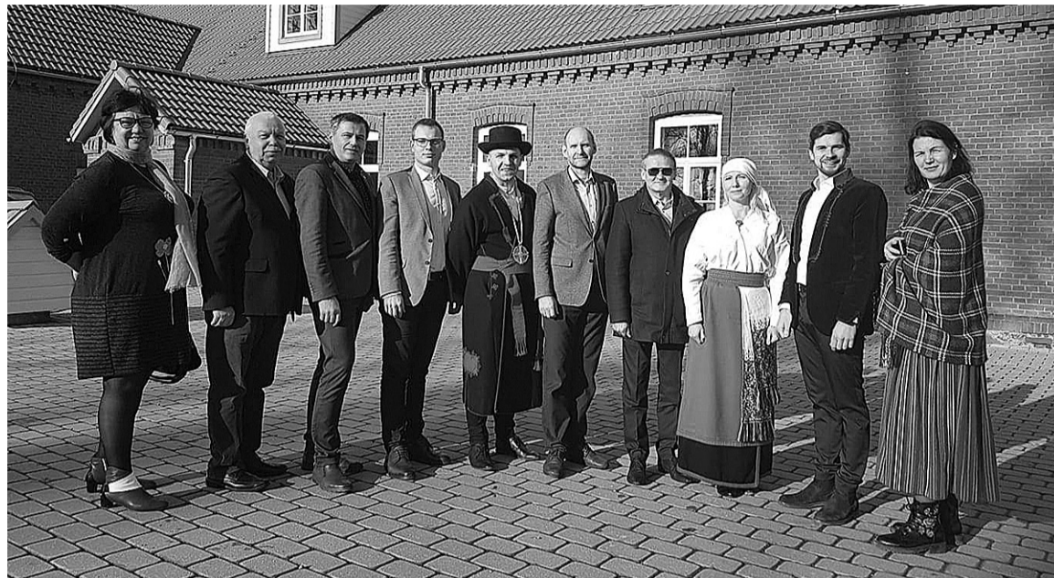
Peräst kokkusaamist tetti Kulla Leerimaja man ütine päeväpilt kah.