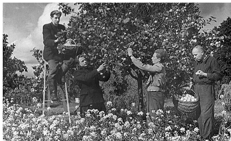
Übinekorjaje Pollin 1957-1960.

Nõndapia, ku muuseumi jälle valla tetäs, tulep Villändi muuseumi välläpanek, kos saap uuri Polli aiataaduse aalugu 20. aastesaa akatuses kuni